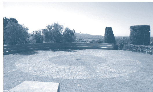
Les Gueules Cassées

Le Domaine de Baudouvin - Jardin Remarquable - Beau jardin, allées de platanes, plein d'espaces intéressants, énorme terrasse avec pergola en bois et le même style d'ombres striées. Présence de l'eau.